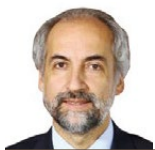
Максимилиано Санта Крус Директор Национального института промышленной собственности Чили

Эта статья подготовлена на основе исследования "Interaction between Intellectual Property and Competition Laws", опубликованного Международным центром по торговле и устойчивому развитию (МЦТУР) и Всемирным экономическим форумом в 2016 году.